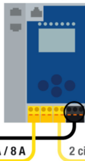
Fig.: Bihl+Wiedemann ofrece la combinación adecuada para cada aplicación: las fuentes de alimentación y