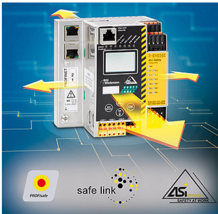
Fig. 1: Gateway di sicurezza AS-i 3.0 con comunicazione di Safe Link integrato per la connessione sicura (BWU3367)

Volete provare dal vivo le nostre idee e le nostre novità? Venite allora a trovarci dal 25 all' 29 aprile 2016 presso il nostro stand H01 nel Padiglione 9 .