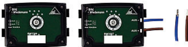
Fig. 4 : Distributore passivo AUX (BW3306, a sinistra, BW3307, a destra)