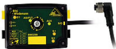
Fig. 3 : Distributore attivo (BW3299)