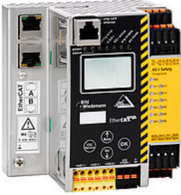
Resim 2: AS-I 3.0 EtherCat ağ geçidi, EtherCat üzerinden emniyet (FSoE), Safe Link (BWU3418)