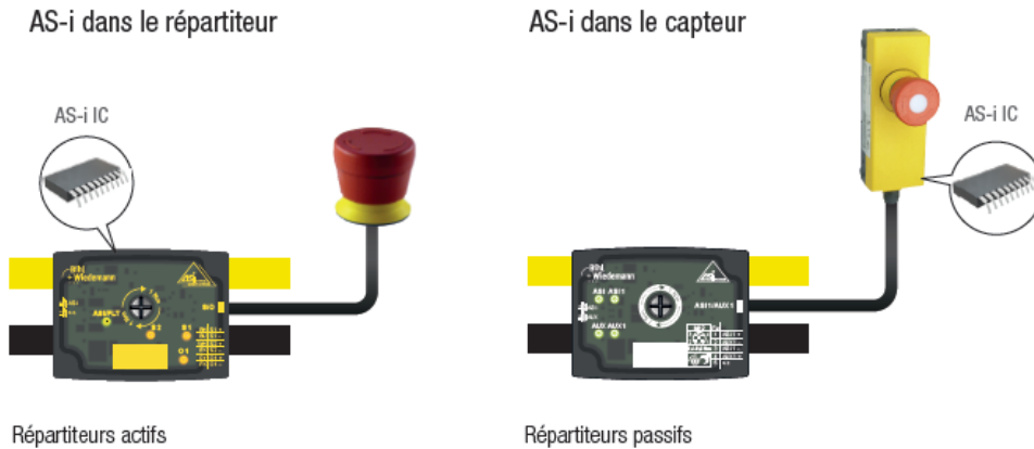
Fig. 1 : Répartiteurs actifs , AS-i dans le répartiteur (à gauche) ; Répartiteurs passifs , AS-i dans le capteur (à droite)

Grâce aux répartiteurs actifs de Bihl+Wiedemann, il est possible de rendre communicant tout type de capteurs et d'actionneurs. La forme singulièrement compacte est optimisée pour les chemins de câble et particulièrement pour les chemins individuels.