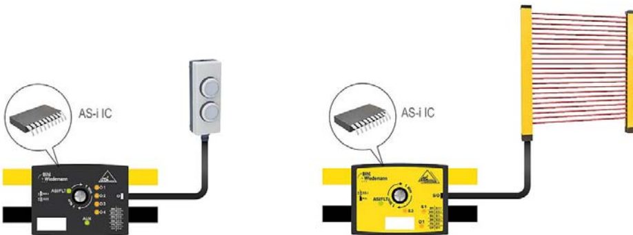
Fig. 2: Distributori attivi AS-i per l'integrazione di sensori, tasti o interruttori standard (a sinistra), distributori attivi AS-i Safety per l'integrazione di sensori, tasti o interruttori di sicurezza (a destra)

Per il vostro impianto state cercando un sistema d'installazione ed un bus semplice e non vorreste fare a meno dei sensori, pulsanti ed interruttori già collaudati? Con i distributori attivi rendete qualsiasi componente compatibile con AS-Interface (AS-i) e potete utilizzarlo con facilità nel semplice e robusto sistema bus AS-i. È anche possibile integrare nelle reti AS-i esistenti sensori senza collegamento AS-i.